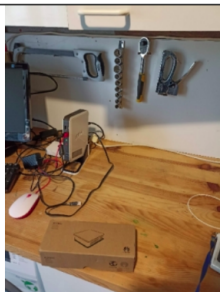
Photo d'ensemble des équipements installés chez le client (PTO,ONT,BOX,...) :

On a déjà deux FTTH qui marchent sur l'offre fibre31 business dont une où la ligne fibre n'était pas présente et a été créée par la commande tetaneutral.net: